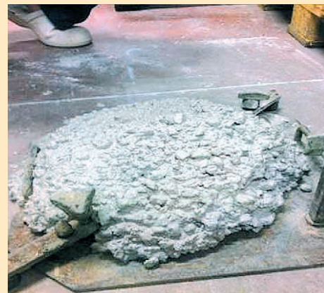
Béton de classe de consistance S5 déterminée par mesure de l'affaissement au cône d'Abrams.