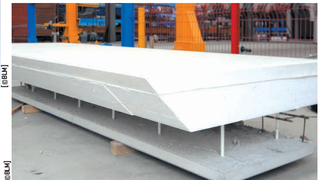
Double mur coffrant Ino'Veur I prêt à être livré.

Afin d'assurer le parfait enrobage béton des tiges traversantes en fibres de verre, une vibration ultrasonique leur est appliquée.