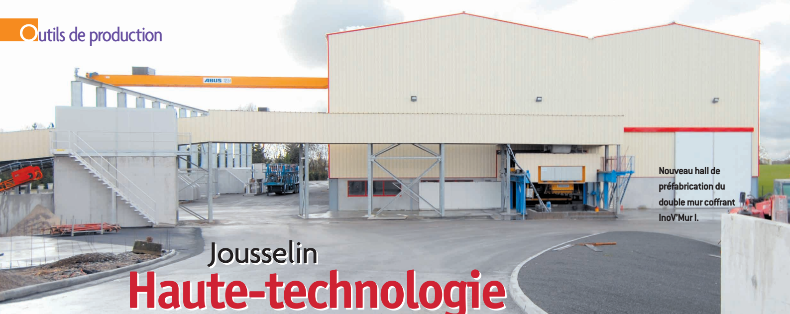
Nouveau hall de préfabrication du double mur coffrant InoV'Mur I.